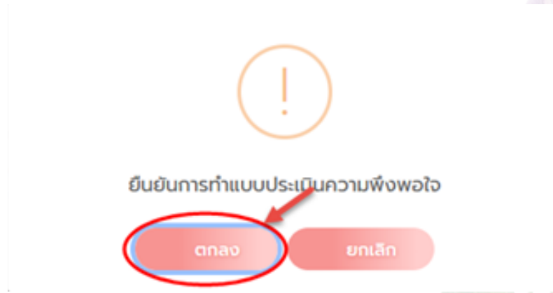
ภาพแสดงหน้าจอ Pop Up ยืนยันการทำแบบประเมินความพึงพอใจ